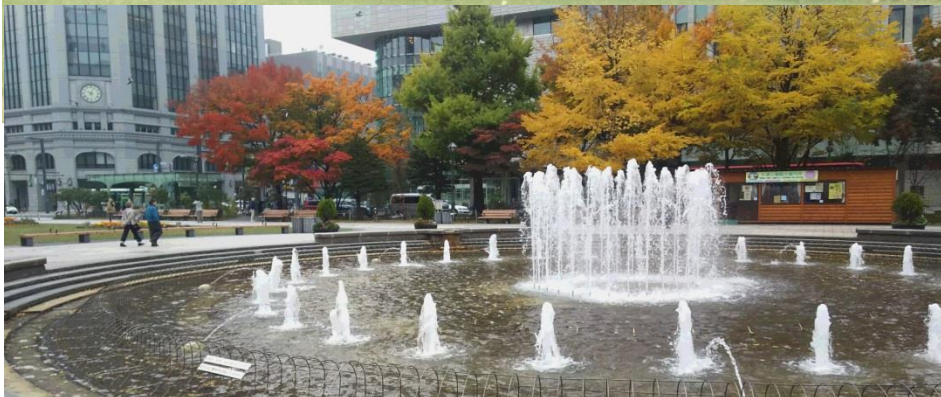
この写真は、翌日、朝の風景です。(紅葉が素晴らしいかったです。)