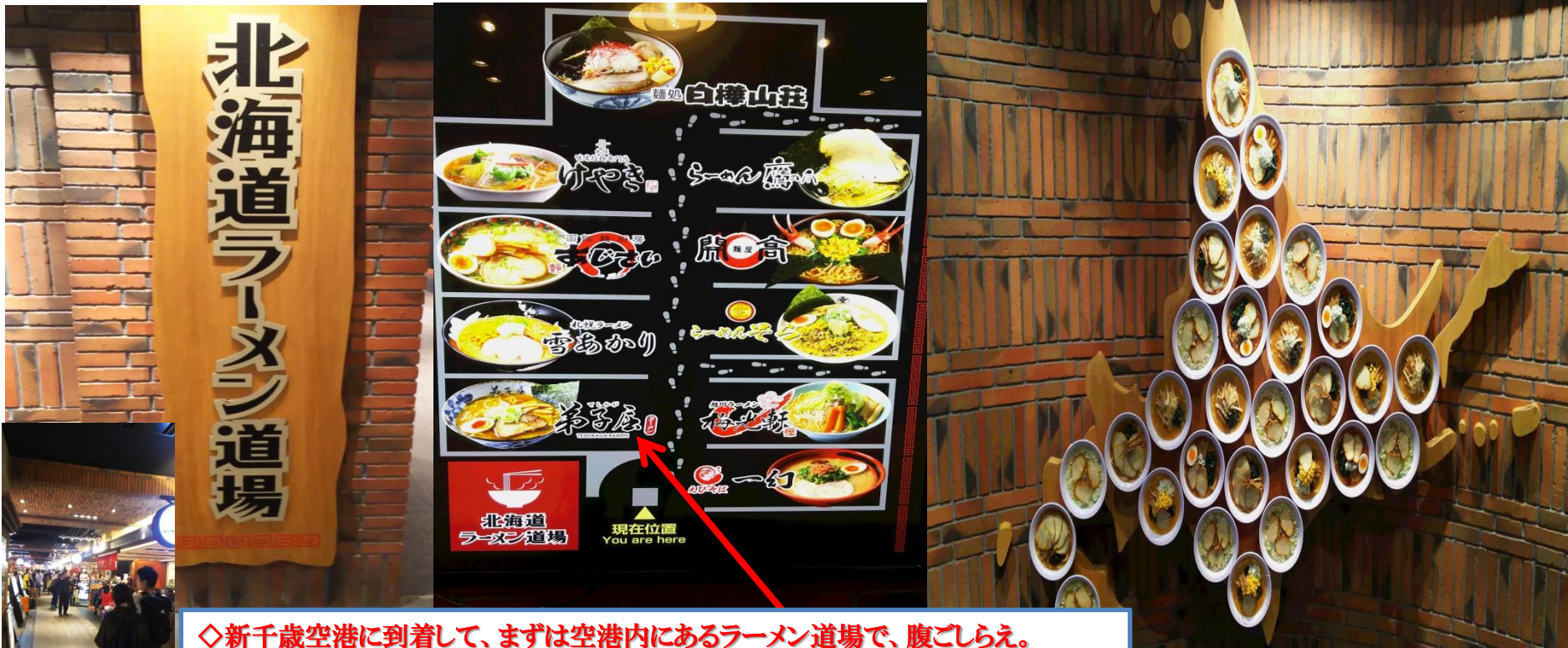
◇新千歳空港に到着して、まずは空港内にあるラーメン道場で、腹ごしらえ。 (最近ブームとなっている弟子屈ラーメンを堪能・・・最高で～す。)