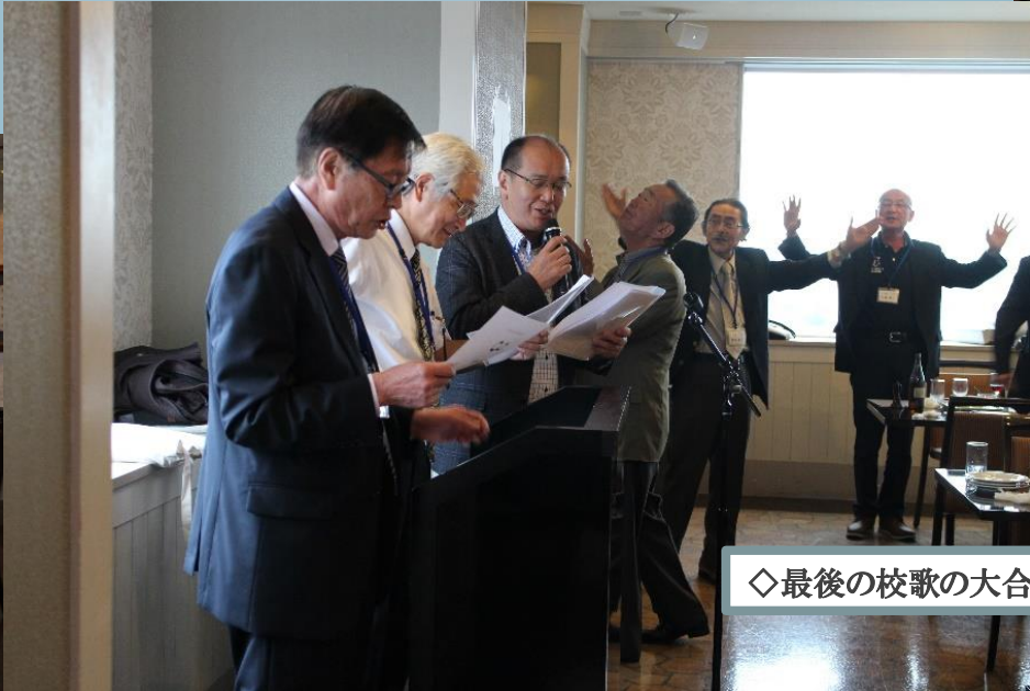
◇最後の校歌の大合唱。