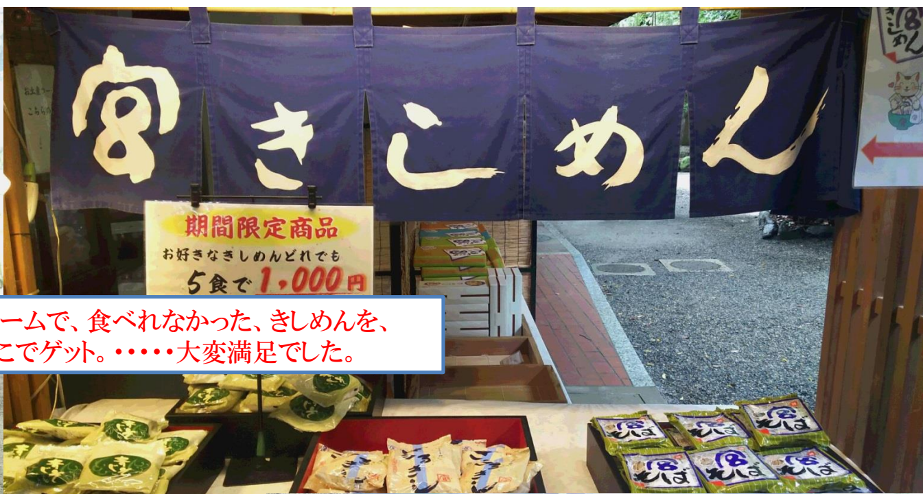
◇新幹線ホームで、食べれなかった、きしめんを、何とかここでゲット。……大変満足でした。