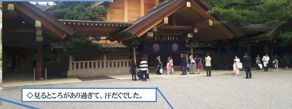
◇見るところがあり過ぎて、汗だくでした。