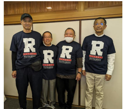
二桁卒業世代： 12・14・15期生