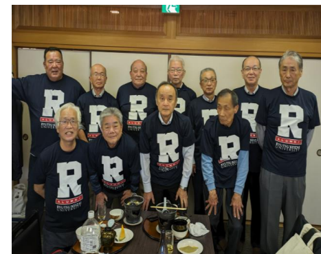
一桁卒業世代： 2・5・6・7・8・9期生