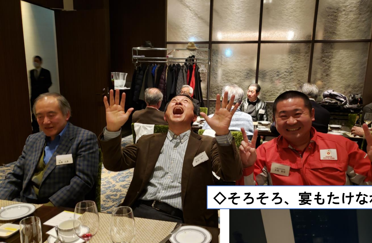
◇そろそろ、宴もたけなわです。