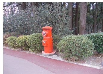
寮への道のポスト